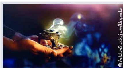
Das undurchsichtige Geschäft mit Esoterik und Spiritualität Seite 8