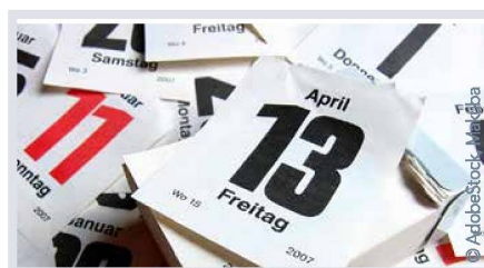
Aberglaube und Magie Seite 11