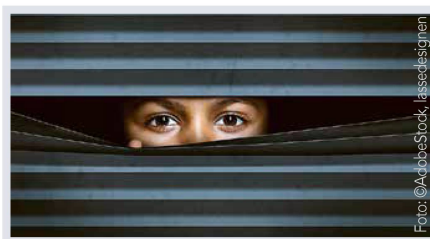
Wie diskriminierend ist die Schweiz? Von Sandro Bucher Seite 8

«Metamorphose» – eine Theater-Tanz-Performance 28