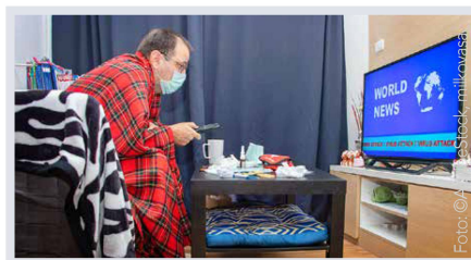
Corona auf allen Kanälen – wem kann ich vertrauen? Seite 8