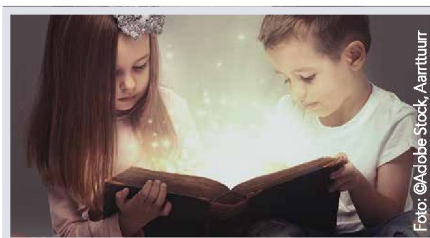
Buchtipps für Kinder und Eltern: Seite 16