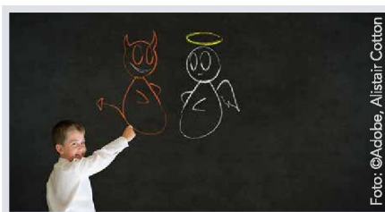
Grosse Unterschiede beim Religionsunterricht in der Schweiz: Seite 8