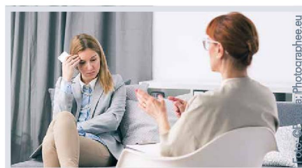
Weltliche Seelsorge – die Situation in der Schweiz und in Europa: Seiten 11 und 14