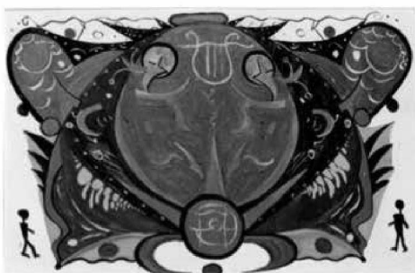
Ohne Titel Bild Nr. 27 Jahr: 1965, 80cmx40cm

8. bis 29. Oktober 2016 Do. bis So. 15 bis 19 h