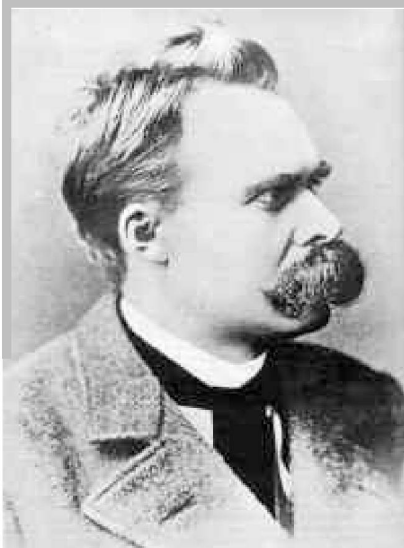
Friedrich Nietzsche 1844-1900