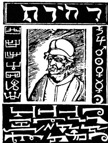
Titelblatt von Abanos Telefonbuch

Sehr zum Ärger der Inquisition riefen geistliche Herren und Damen bald schon nicht mehr nur gut-christliche Geister mit dieser neuen Erfindung zu sich, sondern häufig auch die in einem Callgirl- bzw. Callboy-Ring zusammengeschlossenen, berüch-