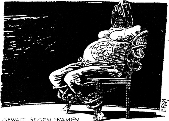
GEWALT BEGEGEN FRAUEN