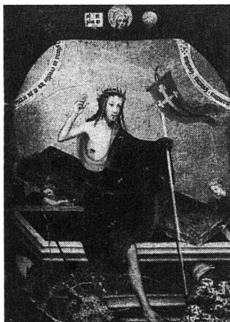
Melchior Broederlam (gest. 1409): Auferstehung

Shanghai. (Reuter) In der Nähe der chinesischen Stadt Shanghai haben Archäologen Gräber entdeckt, in denen vor 4500 Jahren vier Sklaven mit ihren toten Herren lebendig begraben wurden. Die Nachrichtenagentur Neues China meldete, dies sei das älteste Beispiel für eine solche Praxis und lasse erkennen, dass Sklaverei in China 400 Jahre früher eingeführt wurde als bisher angenommen.