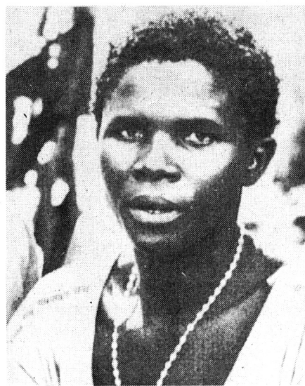
Ihre «Heilig-Geist-Bewegung» ist in Uganda besiegt, sie selbst verwundet: Alice Lakwena.

«Das arme Mädchen hat ein psychiatrisches Problem», hatte Museveni gesagt «sie verschwendet nur unsere Zeit.» In der Tat stellten Alice Lakwena und ihre Soldaten keine wirkliche Bedrohung für die Regierenden in Kampala dar – wie könnten sie auch? Ihre stärkste Waffe ist ihr Glaube an ihre göttliche Mission. Wenn er nur stark genug ist, sagte Alice, würden die Kugeln aus den Waffen ihrer Feinde, in der Luft um-