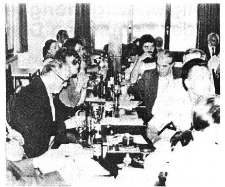
Stimmungsbild aus dem Tagungssaal.