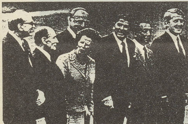
Bonner Gipfeltalnehmer: „Ihr müsst nur selber sehen, daß in eure Wirtschaft in Schwung hätte!“

Kohl dienten sich gegenseitig als Strahlmänner, die ungetrübten Wirtschaftsoptimismus zur Schau trugen — während vor allem in Europa die Arbeitslosenzahlen steigen und die Konjunktur zu verfallen droht.