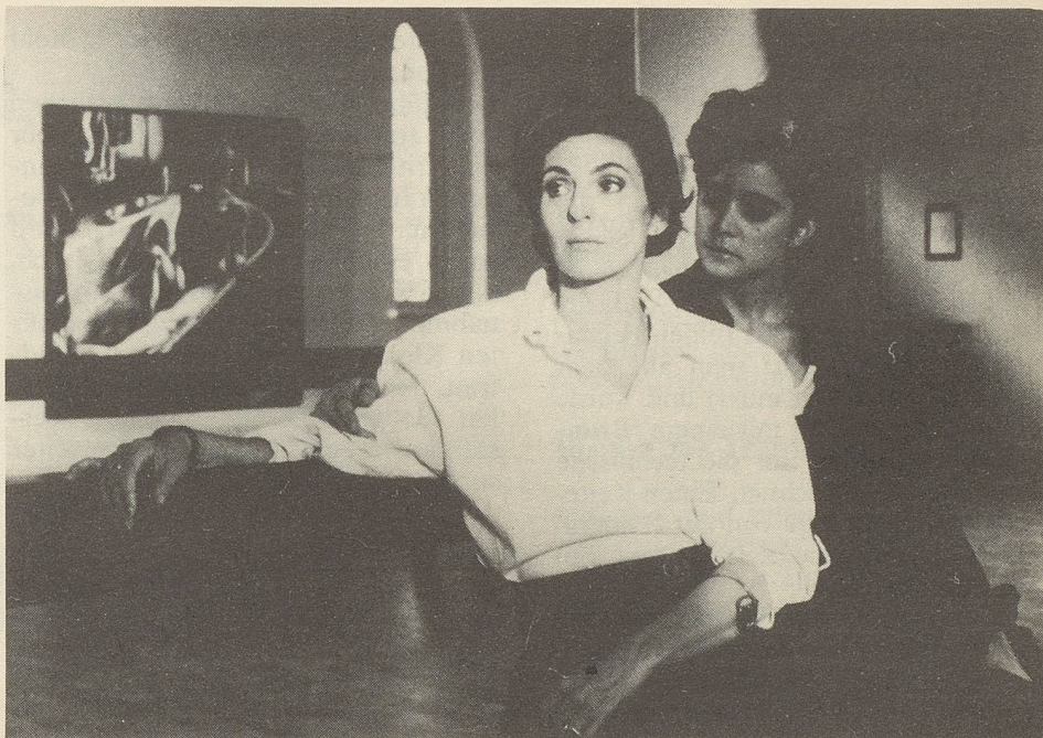
„ I've heard the mermaids singing “