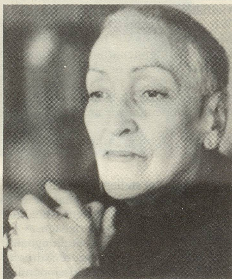
Meret Oppenheim, 1982