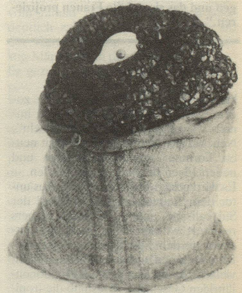
Die alte Schlange Natur, 1970

nach Manets "Déjeuner sur l'herbe" und dem Buch "Venus im Pelz" von Sacher-Masoch) ist die konsequente Weiterführung Ihrer unkonventionellen Schmuck- und Modedesigns, die leider bis auf einige Kleinigkeiten als witzige Kuriositäten nur Skizzen auf Papier