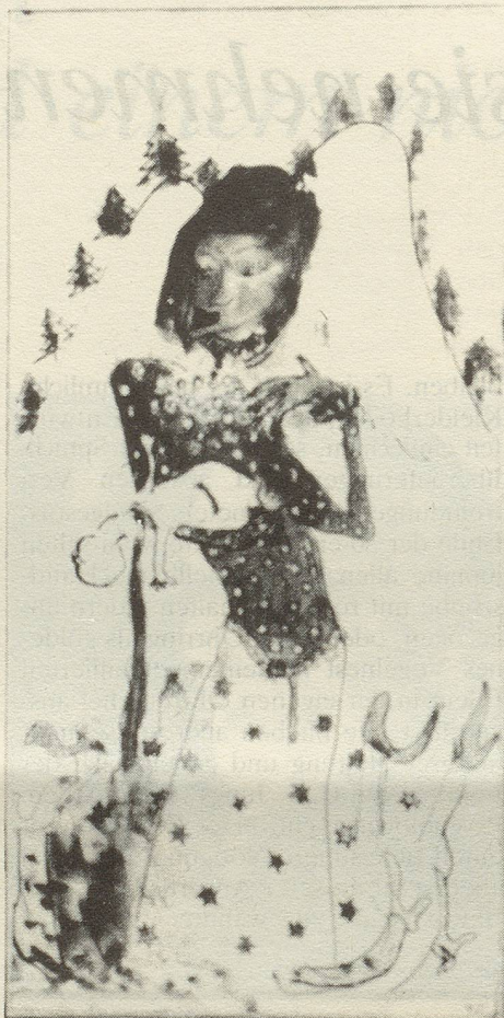
Ex Voto – Der Würgengel, 1931/32

künstlerin profilieren können. Sie zogen es vor, "einer Schlange gleich, immer wieder die Haut zu wechseln", Neues zu schaffen und ständig mit neuen Formen, neuen Materialien und neuen Ideen die Welt zu verblüffen. Es wird gesagt, dass der Dadaismus unter dem Impuls des Lachens und der Surrealismus unter jenem des Fiebers realisiert worden ist. Ihre Kunst entstand aus dem Spiel, aus der Absage an Konventionen und einer doch tief kultivierten Verankerung mit der millionen-jährigen Geschichte. Deshalb die ironisierende Selbstdarstellung in Form einer Röntgenaufnahme Ihres Schädels (1964) oder das Selbstportrait doppelbelichtet mit einer Narbentätoviermaske (1980), womit Sie Ihre Existenz überdeutlich als Folge einer urchichtlichen Entwicklung spürbar machen. Traumhaftes verbinden Sie mit der Realität und schaffen so eine neue, umfassende Wirklichkeit. Ihre Stellung als Künstlerin, als weibliches Wesen mitten unter vorwiegend männlichen Kollegen? Noch heute den-