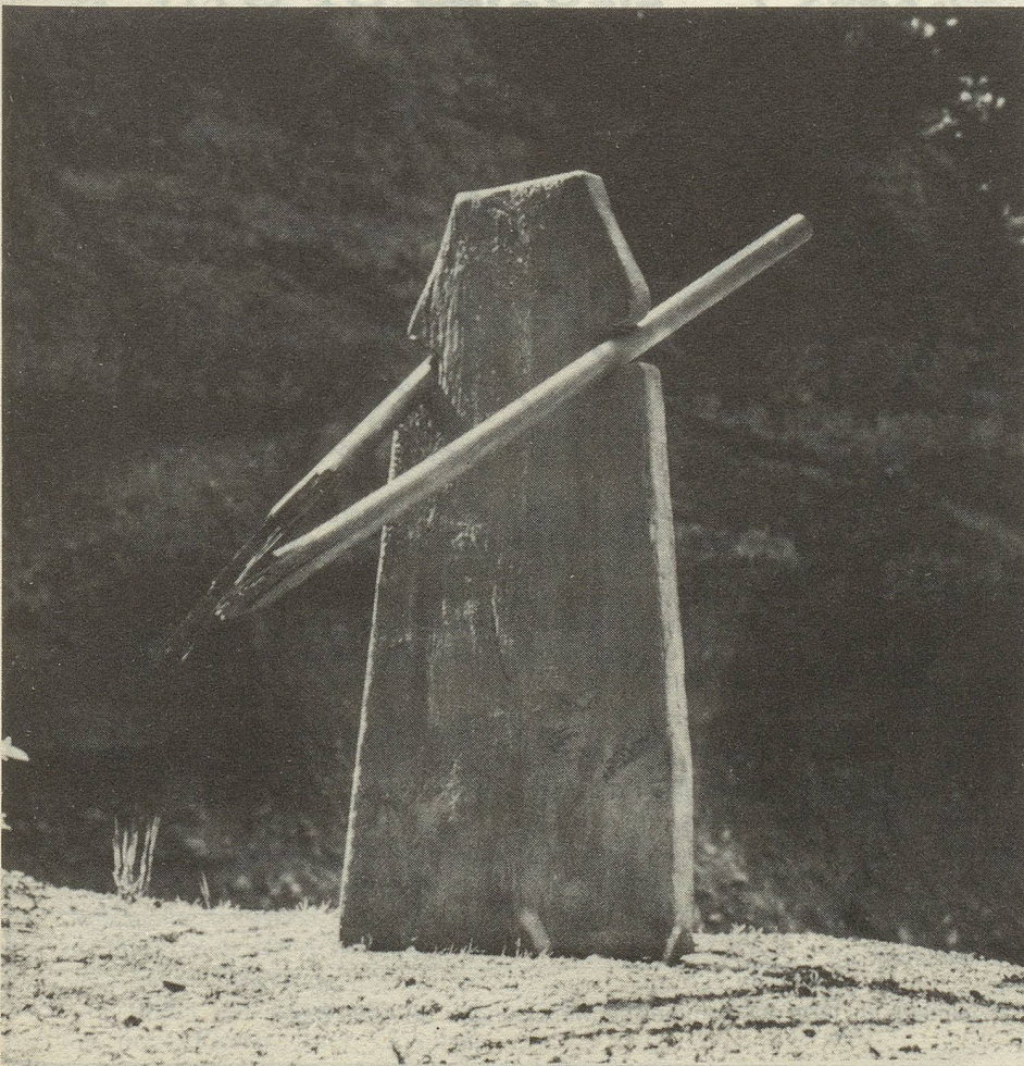
Genoveva, Plastik, 1971

In Ihrer Staub aufwirbelnden Rede vom Januar 1975 haben Sie sich sehr deutlich zum Thema Frauenrechte in der Kunst ausgesprochen: "Das Geistig-Männliche in den Frauen ist vorläufig gezwungen, eine Tarnkappe zu tragen. Warum wohl? Ich glaube, es kommt daher, dass die Männer seit der Errichtung des Patriarchats, d.h. seit der Abwertung des Weiblichen, das in ihnen selbst enthaltene Weibliche, das ja als minderwertig angesehen wird, in die Frauen projizieren. Sie sind also Weib hoch zwei. Das ist doch wohl zu viel." In Ihrer klugen, gelegentlich auch selbstironisierenden Art haben Sie überlegen und spielerisch provokativ bemerkt: "Man sollte sich daran erinnern, dass es Eva war, die zuerst vom Apfel am Baume der Erkenntnis, also des bewussten Denkens, gegessen hat."