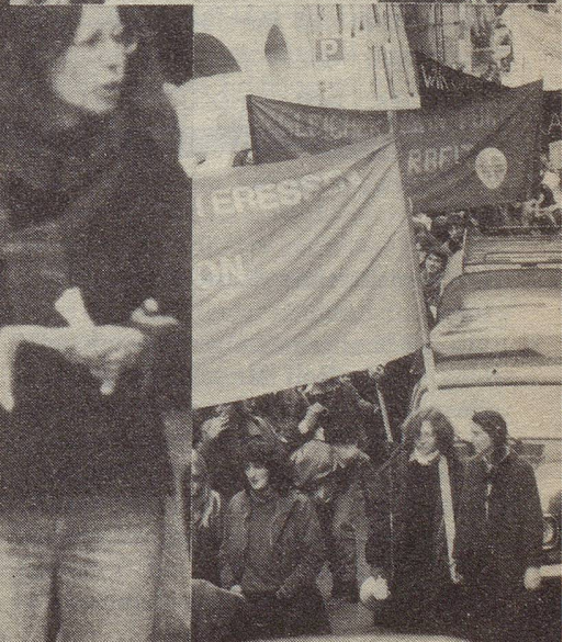
Hintergrundinformationen zum 8. März auf Seite 11 in dieser Nummer.