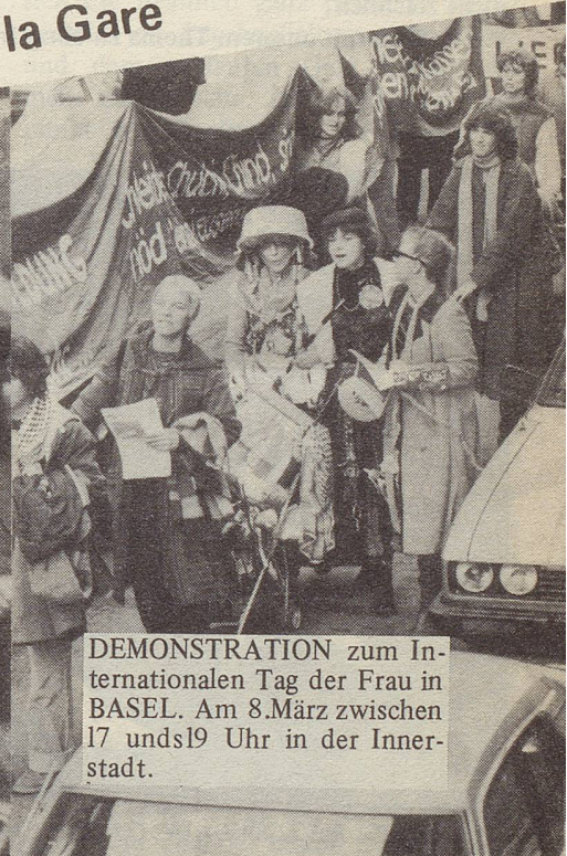
DEMONSTRATION zum Internationalen Tag der Frau in BASEL. Am 8. März zwischen 17 und 19 Uhr in der Innenstadt.