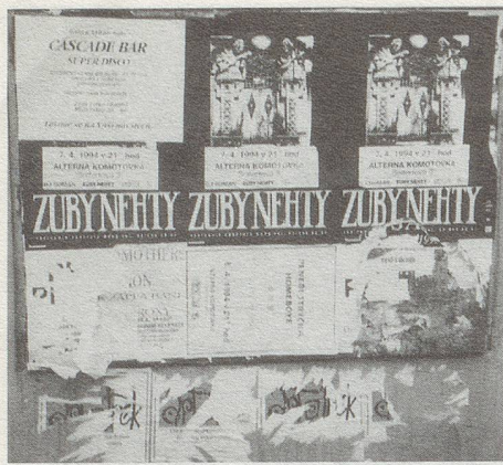
Plakatwand in Prag (Foto: Katka Ráber-Schneider).

chische Patriarchat sieht die Frauen auch heute noch gerne als «kecke Kätzchen», die ihre Weiblichkeit zur Ergötzung der Männerwelt ausspielen. Aber da hat es die Rechnung ohne die alten «Dybbuk»- und heutigen «Zuby nehty»-Frauen gemacht. Die nämlich sind weiblich ohne Koketterie. Sie sind schön durch ihre Natürlichkeit und Verücktheit. Sie sind professionell. Sie sind souverän und voller Einfälle.