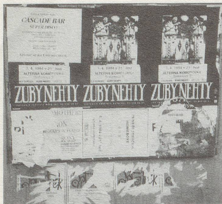
Plakatwand in Prag.

chische Patriarchat sieht die Frauen auch heute noch gerne als «kecke Kätzchen», die ihre Weiblichkeit zur Ergötzung der Männerwelt ausspielen. Aber da hat es die Rechnung ohne die alten «Dybbuk»- und heutigen «Zuby nehty»-Frauen gemacht. Die nämlich sind weiblich ohne Koketterie. Sie sind schön durch ihre Natürlichkeit und Verücktheit. Sie sind professionell. Sie sind souverän und voller Einfälle.