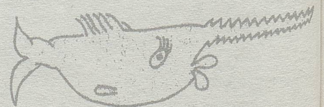
Sägefische aus der Jubiläums-Kampagne «10 Jahre Frauenstimmrecht».

Innerhalb der beiden traditionellen Parteien – der «Vaterländischen Union» und der «Fortschrittlichen Bürgerpartei» – bildeten sich Frauenarbeits-