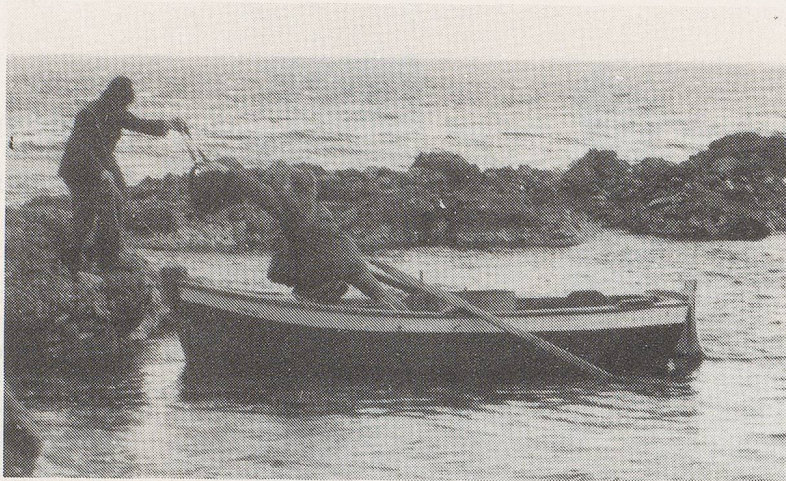
"Donusa" von Angeliki Andoniou (Griechenland)

keit und bar jeglicher Achtung vor den Werten des Lebens entwickelt sich ein gnadenlos morbides, verzweifelter Suchen nach Liebe, Nähe, Wärme und Vergessen. "On the road" erleben wir eine hoffnungslose Suche nach dem verlorenen Paradies.