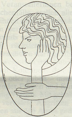
Von Bettina Volland

Vor 122 Jahren durfte die erste Frau an der Universität Zürich ihr Staatsexamen ablegen. Seither haben Frauen theoretisch die gleichen Rechte und Chancen wie Männer auf einen Studienplatz und eine akademische Karriere. Die Wirklichkeit sieht jedoch anders aus: die Männer lehren, die Frauen lernen (immer noch). Obwohl der Anteil der Studentinnen ständig steigt, sind von 328 DozentInnen immer noch nur 8 weiblich! Doch die Frauen wollen dieses Missverhältnis nicht mehr länger hinnehmen. Sie machen sich Gedanken und sie bringen konkrete Vorschläge, wie die Macht an der Uni in Zukunft gerechter verteilt werden könnte.