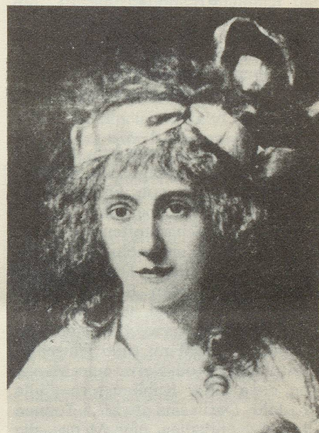
THEROIGNE DE MERICOURT 1760 - 1817

Diese Fragen anhand der sechs Porträts zu beantworten ist der Autorin bestens gelungen. Ein Buch, das uns Frauen Mut macht aber auch Betroffenheit erweckt über die gnadenlose Reaktion einer Männerwelt, wenn Frauen darin für ihre Menschwerdung kämpfen.