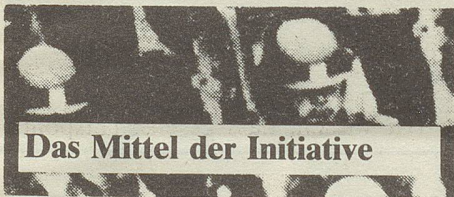
Das Mittel der Initiative

Auch meinen viele Leute, dass im Krieg die Zivilbevölkerung geschützt werden soll. Die Armee im zweiten Weltkrieg wollte sich aber im Falle eines Angriffs von Hitler-Deutschland in die Alpen zurückziehen und die Zivilbevölkerung und 3/4 des Landes ihrem Schicksal überlassen. Der Armee geht es letztlich nur um ihr eigenes Überleben.