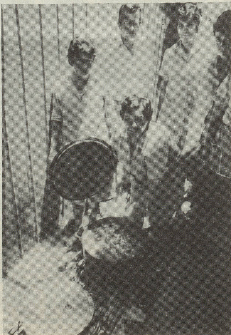
Streikende Frauen organisieren eine Streikküche

Mit diesem Packen an Erfahrung kommt die Militante ins Exil. Mit all diesen Wunden, die entstehen, wenn man geliebte Wesen verliert, dem Trauma, das die durchlebten Horrormomente in den Klauen der feindlichen Bestie zurücklassen, aber auch mit vollen Armen, durch die erhaltende Solidarität, die in Strömen zufließt. Sie kommt mit einer von aussen gealterten Haut, von innen jedoch erneuert, durch die Erfahrung, die Fähigkeit gehabt zu haben, ihre Pflicht gut zu erfüllen. Sie kommt in ein aufgezwungenes, jedoch Übergangsweises Exil, an eine Kampffront, die weniger Kraft hergibt, weniger erfreulich ist, aber nützlich für die Kampffront im Lande – nützlich und notwendig. Es ist das vorläufige Terrain, in dem die Nachhut auf- und ausgebaut