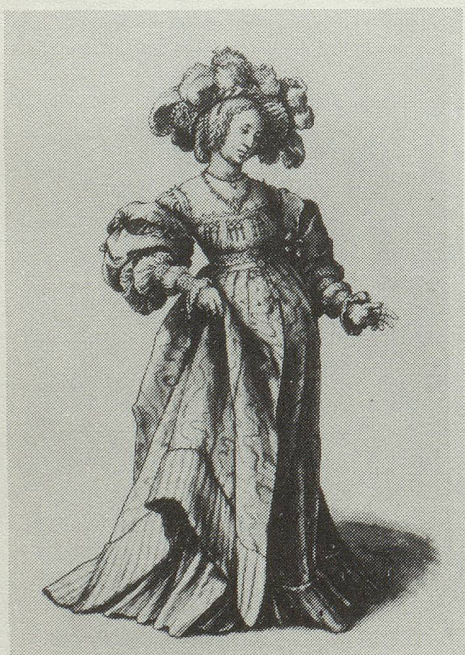
Junge Frau in Basler Tracht von Hans Holbein d.J. (1497/98-1543), Zeichnung aus dem Kupferstichkabinett in Basel.

Merkwürdig, wie wenige von ihnen schwanger sind. (aus: Phyllis Chesler, Über Männer, Hamburg 1979, S.80)