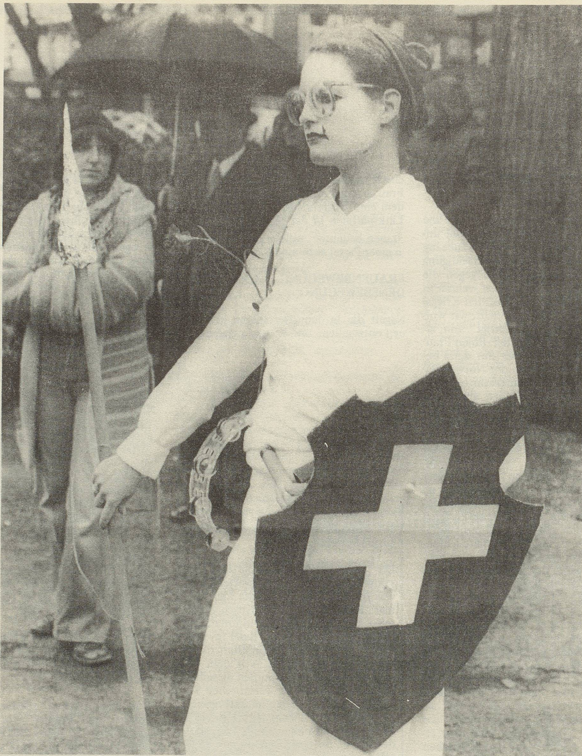
Sind wir zum Mutterlandsdienst bereit?