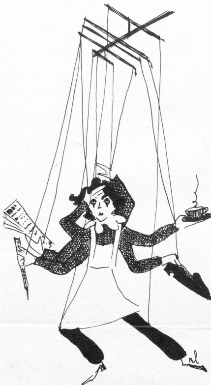
DIE „CHUM-MIR - LÄNG-MIR!“

Heute, zehn Jahre später, scheint man sich darüber mehr Gedanken zu machen. Äusserlich lebt der Brauch aber in seiner traditionellen Form weiter. Neben der Überlieferung