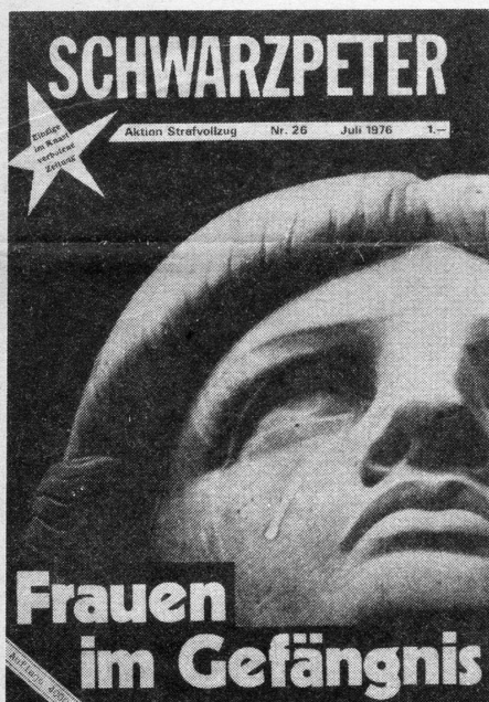
Die ASTRA (Aktion Strafvollzug) hat als erste die Missstände in Hindelbank angegriffen.

Im März 1977 richteten 66 Insassinnen der Strafanstalt Hindelbank eine Petition an Bundesrat Furgler, in der sie um Verbesserungen und Erleichterungen des Strafvollzugs baten. Inzwischen hat die Eidgenössische Kommission für Frauenfragen einen informativen Bericht über den Strafvollzug an Frauen in der Schweiz erstellt und schlägt Massnahmen vor, die dazu beitragen könnten, mit dem Sühne- und Vergeltungsgedanken endlich aufzuräumen und das Postulat der Resozialisierung in den Vordergrund zu stellen. Die Forderungen der Petition stellen sich als sehr dringend heraus.