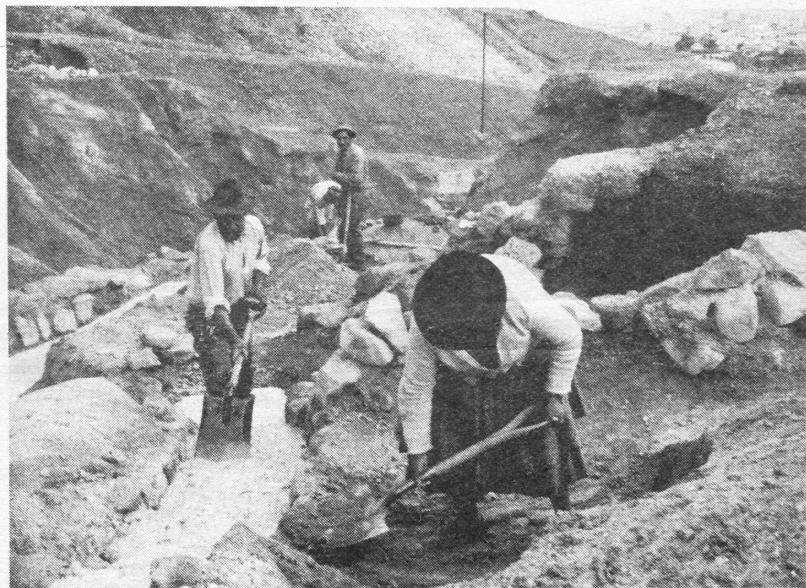
Die Minenarbeiter in Bolivien haben bereits eine kämpferische und revolutionäre Geschichte. Jetzt haben sich auch die Frauen begonnen, zu organisieren, und zwar in „Hausfrauenkomitees“ .

Oft haben die Arbeiter in Siglo XX schon gestreikt, z.B. um Lohnkürzungen zu verhindern. Dann sperrte das Militär jeweils die Zufahrtswege ab, d.h. die Minenstadt wurde ausgehungert, da keine Lebensmittel und Medikamente mehr hergebracht werden konnten. Einige Male besetzte das Militär die ganze Stadt, und es kam zu Massakern, bei denen Arbeiter, Frauen und Kinder zusammengeschossen wurden.