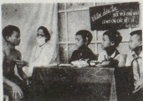
Die Frauenunion Vietnams garantiert regelmässige ärztliche Untersuchungen für Waisenkinder.

Nach mehr als 30 Jahren ist der Krieg in Vietnam 1975 endlich beendet worden. Zurückgeblieben ist ein zerstörtes Land und Tausende von Kriegswaisen. Die Frauenunion Vietnams, ebenfalls Mitglied der IdFF, hat sich die Betreuung dieser Kinder zur besonderen Aufgabe gemacht. Für diese grosse Aufgabe fehlt es jedoch an grundlegenden Dingen wie Medikamenten, Milchpulver, Babynahrung sowie