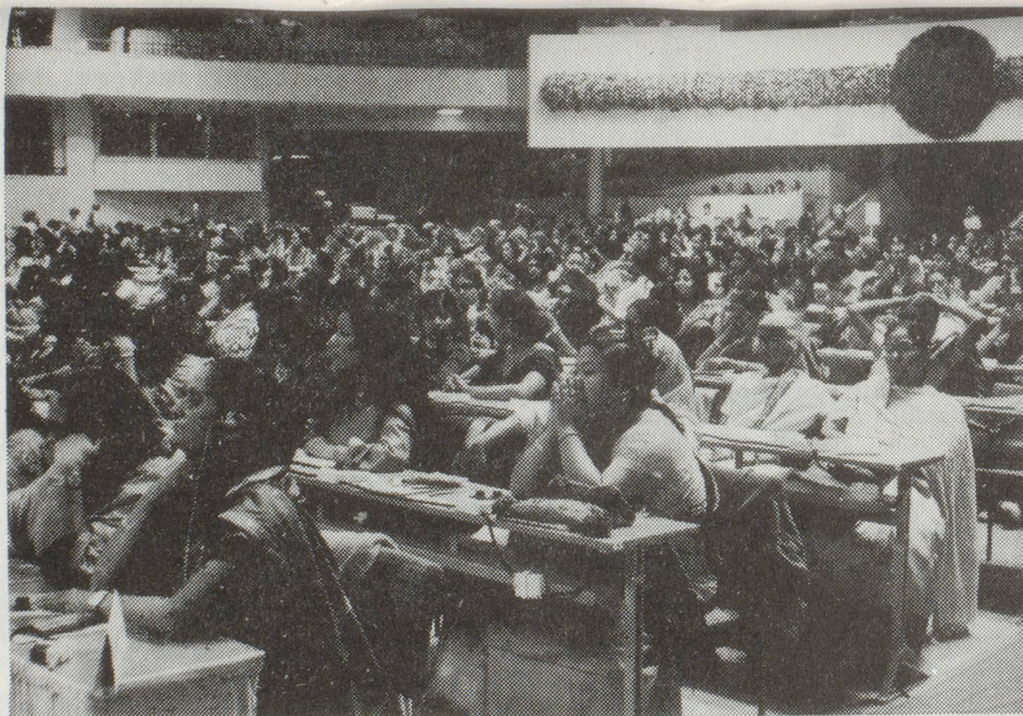
1975 organisierte der IdFF einen Weltkongress, der unter dem Motto "Gleichberechtigung, Entwicklung und Frieden" stand.

An zahlreichen Seminaren und Konferenzen werden die Erfahrungen der nationalen Frauenorganisationen ausgetauscht, damit in jedem Land die Erfahrungen der andern fruchtbar gemacht werden können.