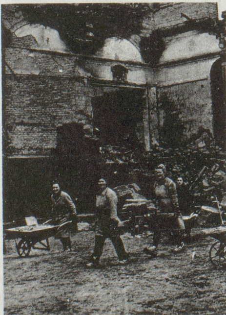
Die "TRÜMMERFRAUEN" - oft ohne zweckmässige Kleidung und ausreichende Ernährung, mit Kopftuch und Holzschuhen. Allein in Berlin gab es 50 000. Sie standen am Anfang des Wiederaufbaus. Sie räumten die Stadt von den Trümmern.

Nur wenige Monate waren seit Beendigung des zweiten Weltkrieges vergangen. Die ganze Welt war erschüttert, und das Leid, die körperlichen und seelischen Wunden, die der Krieg hinterlassen hatte, waren noch nicht verheilt. 33 Millionen Menschen verloren durch die Agression des deutschen Hitlerfaschismus ihr Leben. In der Sowjetunion waren es allein 20 Millionen Tote. Europa lag in Trümmern. Die Frauen, vom Kriege weniger betroffen als ihre Männer und Söhne, stellten ihre ganze Kraft in den Neuaufbau.