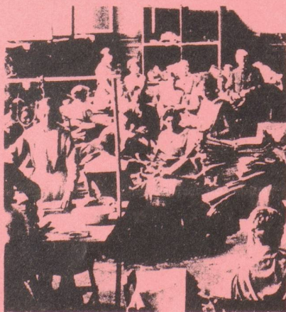
Frauen aus aller Welt. Frauen aus aller Welt sind im IdFF organisiert, in der Internationalen demokratischen Frauenföderation. "Frauen" berichtet über Entstehung, Geschichte und Tätigkeit der IdFF. S. 10