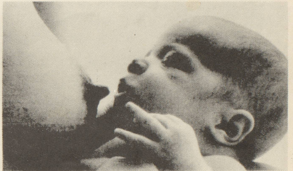
Zur Mutterschaftsversicherungs-Initiative der OFRA: Siehe nebenstehenden Artikel

Ausser den Differenzen über das Vorgehen — Gesetzesebene oder Initiative — bestehen auch noch inhaltliche Differenzen. Die FdP-Arbeitsgruppe verlangt z.B. in ihrem Vorschlag die Finanzierung der Kosten über Beiträge der Versicherten (also der Frauen). Im OFRA-Vorschlag ist die Kostendeckung jedoch über Lohnprozente der Arbeitnehmer und Arbeitgeber (also auch der Männer) vorgesehen. Dieses Solidaritätsprinzip zwischen Männern und Frauen, verheirateten und ledigen, scheint uns ein Grundprinzip der Initiative, das nicht aufgegeben werden darf. Mutterschaft soll endlich von der ganzen Gesellschaft anerkannt und getragen werden. Beiträge des Bundes und der Kantone sind im Vorschlag der FDP wie auch im OFRA-Vorschlag vorgesehen.