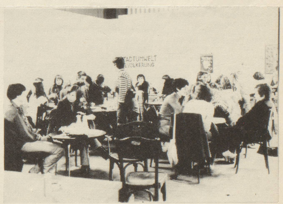
Frauen unter sich

"wir (frauen) wollen nicht bestehende kunstrichtungen verändern, da wir uns dort männlichen normen anpassen müssten. andere gruppen (künstler) gehen vom bestehenden aus und können im gegensatz zu uns ihre bedürfnisse und forderungen formulieren. wir nicht. unsere ausgangssituation ist anders. unsere wirklichkeit ist in den bestehenden formen (kunst und gesellschaft) nicht vorhanden, oder manipuliert. das bild, das von männern in kunst oder werbung von uns gemacht wird, ent-