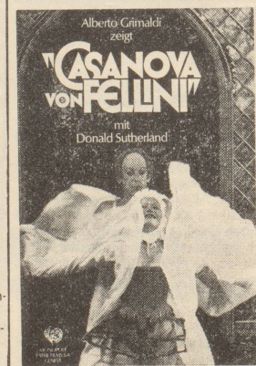
Noch einmal: Casanova

Wir Frauen in der Redaktion waren uns keineswegs einig über den Film "Casanova" von Fellini. Darum haben wir beschlossen unsere Leserinnen an der Diskussion teilnehmen zu lassen. Während wir in der Mai-Nummer der "Emanzipation" die Meinung: "Der Film zeigt ein Stück Realität, er ist empfehlenswert" zu Worte kommen liessen, wollen wir jetzt einer Gegenposition Platz geben. Die Autorin sagt: "Früher war ich glühende Fellini-Verehrerin".