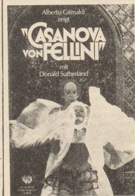
Noch einmal: Casanova

Wir Frauen in der Redaktion waren uns keineswegs einig über den Film "Casanova" von Fellini. Darum haben wir beschlossen unsere Leserinnen an der Diskussion teilnehmen zu lassen. Während wir in der Mai-Nummer der "Emanzipation" die Meinung: "der Film zeigt ein Stück Realität, er ist empfehlenswert" zu Worte kommen liessen, wollen wir jetzt einer Gegenposition Platz geben. Die Autorin sagte: "Früher war ich glühende Fellini-Verfehrerin".