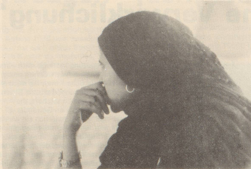
Die Begleiterin der OFRA—Delegation in der SAHARA

Mana und allen Sahrauis, mit denen wir sprachen, geht es um viel mehr als um momentane Erfolge. Sie kämpfen letztlich um die Freiheit ganz Afrikas von allen imperialistischen Einflüssen. Dass hinter den mauretanischen und marokkanischen Soldaten spanische, französische und amerikanische Interessen stehen, sahen wir sehr anschaulich an den Marken des erbeuteten Kriegsmaterials,