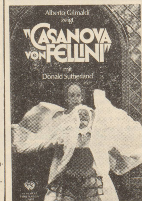
Noch einmal: Casanova

Wir Frauen in der Redaktion waren uns keineswegs einig über den Film "Casanova" von Fellini. Darum haben wir beschlossen unsere Leserinnen an der Diskussion teilnehmen zu lassen. Während wir in der Mai-Nummer der "Emanzipation" die Meinung: "der Film zeigt ein Stück Realität, er ist empfehlenswert" zu Worte kommen liessen, wollen wir jetzt einer Gegenposition Platz geben. Die Autorin sagt: "Früher war ich glühende Fellini-Verehrerin".