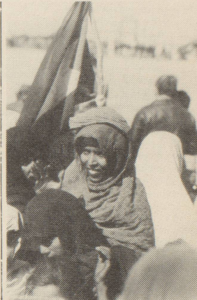
Am 20. Mai feierten die Saharais den Beginn ihres Unabhängigkeitskampfes vor 4 Jahren. (vgl. Augenzeugenbericht S. 41)

Doch, wir wehren uns mit allen Mitteln gegen den Sozialabbau. Und die OFRA hat alle Frauenorganisationen aufgerufen, dem Sparpaket und der Mehrwertsteuer eine klare Abfuhr zu erteilen. Wir unterstützen das Referendum gegen das "Sparpaket"! Wir stimmen am 12. Juni NEIN zur Mehrwertsteuer.