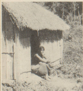
Wie leben die Paï-Indianer?

Ich habe an der Uni Ethnologie und Urgeschichte studiert mit dem Ziel, einmal in die Dritte Welt, wenn möglich nach Südamerika, zu gehen. Zuerst aus wissenschaftlichen Motiven. Nachdem ich gesehen habe, dass man Völker nicht einfach studieren kann, wenn sie gleichzeitig vor der Ausrottung stehen, habe ich mich entschlossen, einen Weg zu suchen, wie ich mein Interesse an fremden Kulturen mit einer vernünftigen Hilfe verbinden könnte. Konkret hat sich dann für mich und meinen Mann dieses Projekt in Paraguay angeboten.