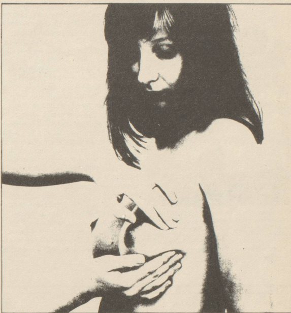
Die Brustuntersuchung kann man selber machen. Ihr Arzt soll Ihnen zeigen wie!

Viele Frauen, die den Fragebogen ausgefüllt haben, nehmen Verhütungsmittel, in den meisten Fällen die Pille. Selten informieren die Frauenärzte