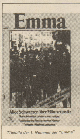
Titelbild der 1. Nummer der "Emma"