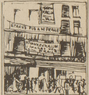
Protest an Krankenkassen-Hausfassade: «Spared nöd a de Fraue»

Das von der Frauenbefreiungsbewegung Zürich, den Progressiven Frauen Zürich und der Spitalgruppe Winterthur lancierte Protestschreiben gegen die Massnahme der Krankenkassen, die gynäkologische Kontrolluntersuchung nicht mehr zu bezahlen, wurde von etwa zwei Dutzend Frauen beim Kantonalverband der Krankenkassen überbracht. Gleichzeitig wurden an der Hausfassade Transparente angebracht, mit den beiden Forderungen «Krankenkasse spared nöd a de Fraue» und «Sofortige Uebernahme der gynäkologischen Kontrolluntersuchung durch die Krankenkassen». Über 4000 Frauen und Männer haben das Protestschreiben unterstützt. Wie uns die Reaktion der angesprochenen Leute eindeutig zeigt, ist die Empörung in der Bevölkerung über diese kurzsichtige und asoziale Massnahme gross. Es ist bekannt, wie wichtig die jährliche Untersuchung für die Frauen ist, um eventuelle Veränderungen im Frühstadium zu erkennen, und dank der frühen Diagnose eine