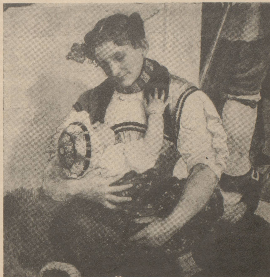
Das neue Vorbild für die entlassenen Frauen?

Niemand kann uns über die Wahrheit hinwegtäuschen: Frauen werden zuerst entlassen, weil sie Frauen sind. Aber das Bürgertum versucht, uns Sand in die Augen zu streuen. Bürgerliche Frauen machen mit. Der Schweizerische Katholische Frauenbund glaubt, "dass die Rezession nicht in erster Linie die Frauen aufgrund ihres Geschlechtes, sondern AHV-Bezüger (Männer und Frauen), Zweitverdiener und Teilzeitarbeiterinnen ohne Sozialverpflichtungen treffe." (nach NZZ, April 75) Teilzeitarbeiterinnen und Zweitverdiener, das sind Frauen. Nach dem Gesetz ist nämlich immer noch der Mann der Ernährer der Familie. Doch die Wirklichkeit richtet sich