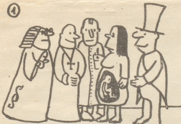
Schützt das Leben...

Schon die Einführung des Abtreibungsverbotes war für das Bürgertum eine mühsame und zeitraubende Angelegenheit. Vom ersten Entwurf bis zum Inkrafttreten der entsprechenden Gesetzesartikel vergingen immerhin fast 20 Jahre. Die Diskussion um das im Rahmen des neu zu schaffenden eidgenössischen Strafgesetzbuches einzuführende Abtreibungsverbot wurde von der Arbeiterklasse und ihren Parteien heftig und bewegt geführt. Das Verbot betraf schon damals in erster Linie Frauen und Familien der Arbeiterklasse, die unter den Bedingungen von Massenarbeitslosigkeit, miserablen Löhnen und entsprechenden Arbeitsbedingungen sich zu reproduzieren hatte. Die Kommunisten traten für die Freigabe der Abtreibung ein, während die Sozialdemokraten sich nicht zu einer einheitlichen Haltung im Interesse der Frauen und der Arbeiterfamilien durchringen konnten: Eine Minderheit unterstützte zwar ebenfalls die Forderung der Freigabe, aber die Mehrheit neigte zum Kompromiss, sie unterstützte die Indikationslösung, die auch die soziale Indikation miteinbeziehen sollte.