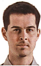
Von Moritz Bandhauer

Der Zeitplan des «Sachplan geologische Tiefenlager» ist ambitioniert, für allfällige Unsicherheiten gibt es keinen Platz. Obwohl die Standortwahl mit grossen Schritten voranschreitet, sind noch viele offene Fragen zu klären. Der Weg zu einem sicheren Tiefenlager bleibt steinig.