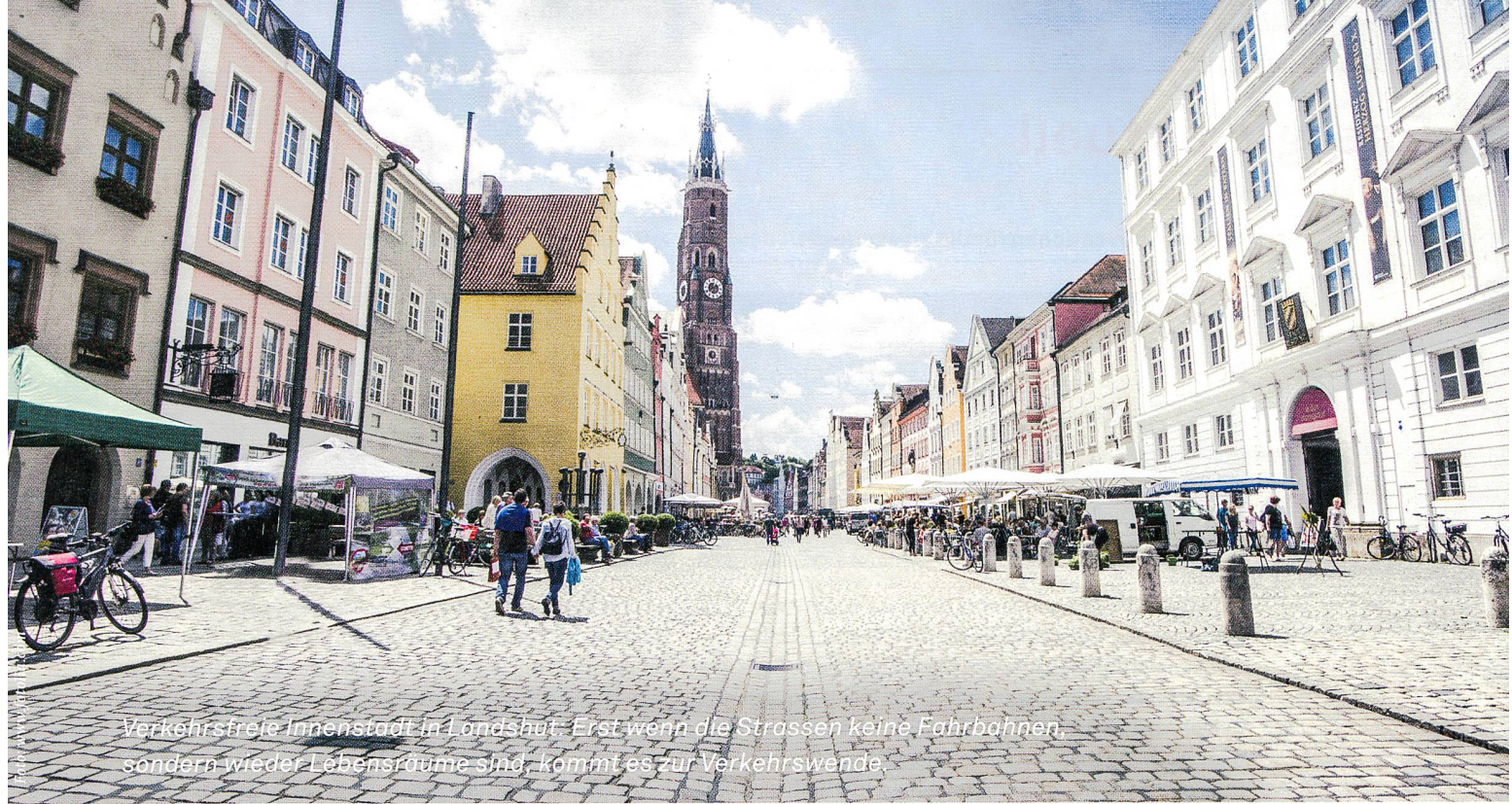
Verkehrsfreie Innenstadt in Landshut. Erst wenn die Strassen keine Fahrbahnen, sondern wieder Lebensräume sind, kommt es zur Verkehrswende.

wunderbaren Verkehrsmittels Auto zu neuen Disziplinen des «Verkehrswesens», das Richtlinien, Regelwerke und Berechnungsmethoden nach dem neuen Mass, dem Auto, erstellte und die Zukunft nach den Prognosen eines ewigen Wachstums gestaltete. Begriffe wie Mobilität, ursprünglich nur für die soziale Mobilität erdacht, wurden neu interpretiert und zum Geschäftsmodell für Bauindustrie und Banken. Berechnet wurde der Nutzen plausibel aus Zeiteinsparungen durch Geschwindigkeit. Die Grundlage der Verkehrsökonomie, die Raumplanung erfreute sich dieser Erreichbarkeitsausdehnung und wandelt seither Natur in lukratives Bauland. Wertschöpfung aus dem Nichts durch Umfärbung in Plänen.