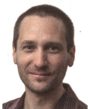
Von Felix Nipkow

Ob eine Wirtschaft ohne Wachstum möglich ist oder das Wachstum so gestaltet werden kann, dass es nicht auf Kosten kommender Generationen geht, darüber streiten sich die klassische und die Postwachstumsökonomie. Energie spielt eine Schlüsselrolle. Theoretisch wäre genügend Sonnenenergie vorhanden, dennoch ist nicht klar, welcher Weg der richtige ist. Die SES sucht Antworten.