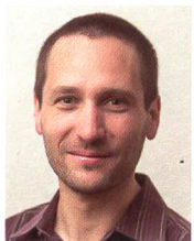
Von Felix Nipkow

Die Schweiz hat beste Voraussetzungen für den Atomausstieg: Der Stromverbrauch ist dank steigender Energieeffizienz stabil. Das Potenzial erneuerbarer Energien ist riesig. Dank der Wasserkraft ist die Schweiz ideal positioniert für eine erneuerbare Stromversorgung. Als letzte Bedingung braucht es nun am 27. November noch ein Ja zum geordneten Atomausstieg.