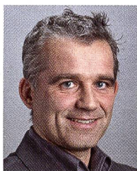
Von BEAT JANS*

Die Frage der Rückverteilung wird seit Jahrzehnten ausgeblendet. Das ist der Hauptgrund, warum Lenkungsabgaben in der Schweiz nicht vom Fleck kommen.