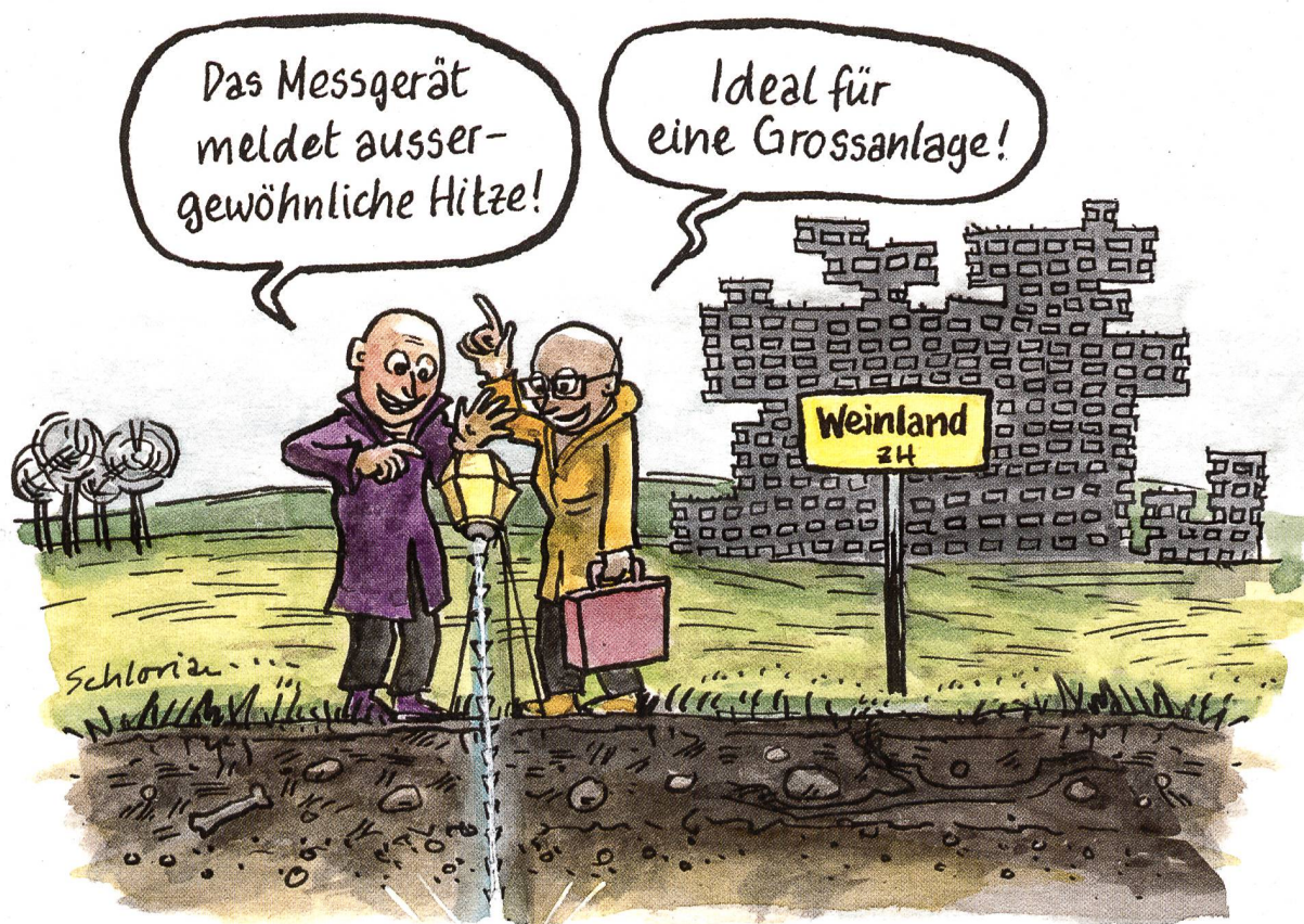
Cartoon: Stefan Haller

Geothermie, 500 Jahre nach Erstellung des atomaren Tiefenlagers