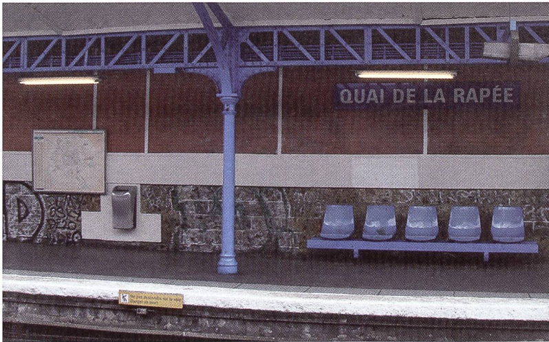
Stromvergeudung «à la française». Die Pariser Metro, hier die Linie 5: U-Bahn und Licht beziehen Strom von der gleichen Leitung; das Licht wird tagsüber nie ausgeschaltet.

grünen Umweltministerin Dominique Voynet, eine französische Besonderheit zu korrigieren und ein Gesetz zu erlassen, damit der dreckige Diesel teurer wird als Benzin. Leider aber wurde keine Verordnung erlassen. Heute noch ist an den französischen Tankstellen der Diesel günstiger als Benzin. Hinter den Vorhängen der Pariser Ministerien können die Lobbys also viel bewirken, sprich verhindern, und es gibt etliche Beispiele dieser Art. Wird die Atomlobby die Energiewende und die 50%-Limite für Atomstrom ebenfalls noch verhindern können?