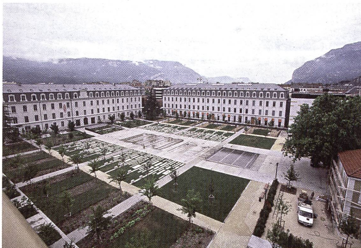
Und es geht: In der Stadt Grenoble, auf einem ehemaligen Kasernenareal, entstand mit dem «ZAC de Bonne» ein beispielhaftes Ökovierteil.

Die Energiewende ist bislang – nach Jahrzehnten der Atomideologie – in der Öffentlichkeit noch (zu) wenig erklärt worden. Nun gibt es zwar Ziele, aber keinen Kalender und keine «to do»-Liste dazu. Politisch schweben also zwei Botschaften in der Luft: die Notwendigkeit der Energiewende und die Notwendigkeit erster Stilllegungen, aber keine verbindlichen Umsetzungsschritte dazwischen. Wird die Schliessung