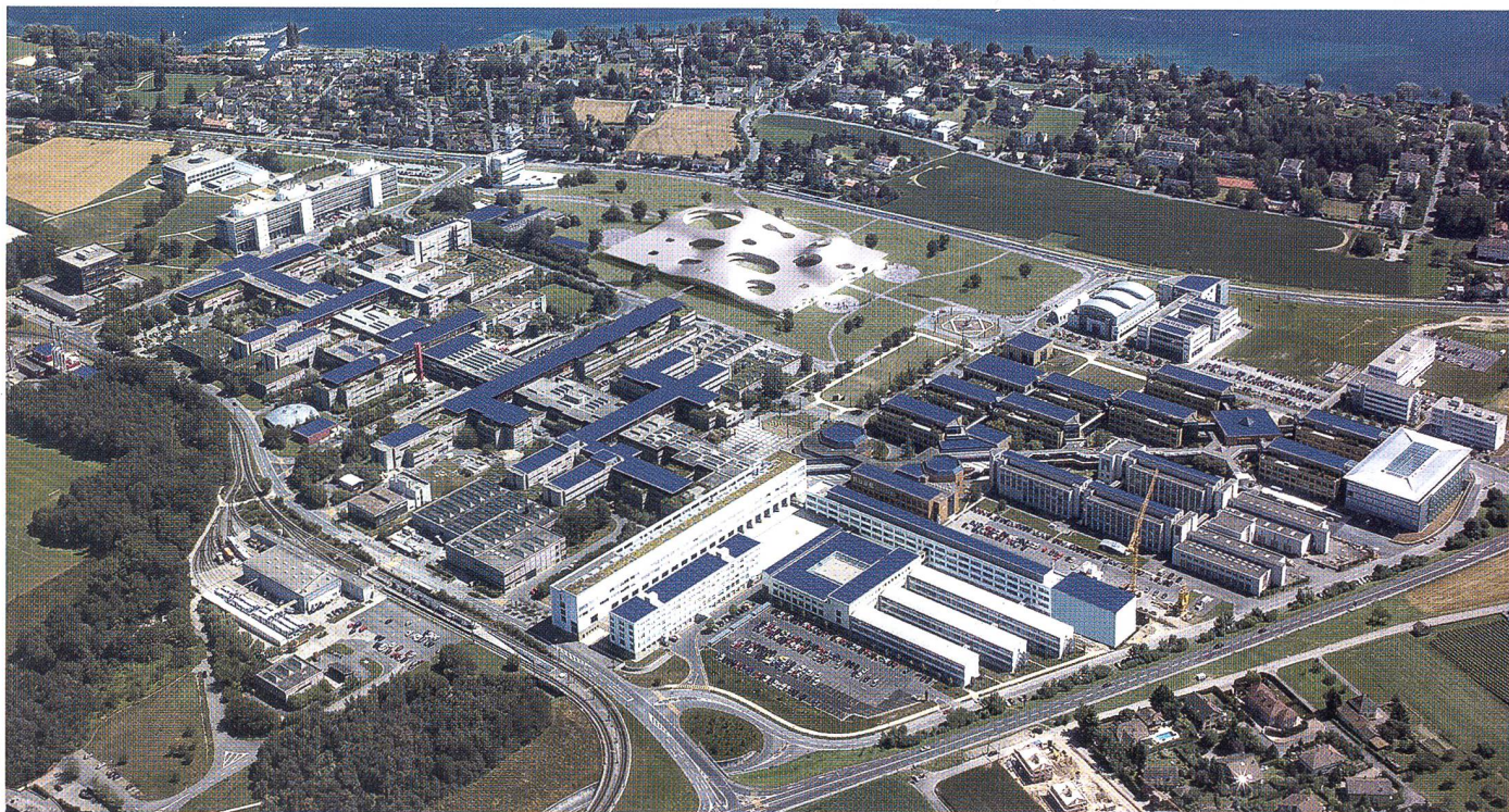
Die Zukunft ist erneuerbar: Das Bild zeigt die grossflächige Fotovoltaikanlage auf dem Dach der EPFL Lausanne.

« Fukushima war der dritte grosse Kernreaktorunfall. Nach Harrisburg konnte man behaupten, die Sicherheitssysteme hätten immerhin funktioniert. Nach Tschernobyl hat man sich damit herausgeredet, dass dort eine ganz andere Technologie angewendet wurde. Nach Fukushima gibt es keine Ausreden mehr. Als Ingenieur habe ich das Vertrauen verloren, dass tatsächlich alle erdenklichen Betriebszustände berücksichtigt werden können. Der Schaden durch einen Unfall aber, der ist unüberblickbar und nicht zu managen. Dennoch wäre ich bis vor kurzem bereit gewesen, Kernenergie als notwendiges Übel zu akzeptieren. Aber inzwischen bin ich überzeugt: Wir haben mit den erneuerbaren Energien eine Alternative. Nehmen wir die Solarenergie: Diese wird in den nächsten Jahren weitere Technologiesprünge machen und gleichzeitig werden die Kosten massiv herunterkommen. »