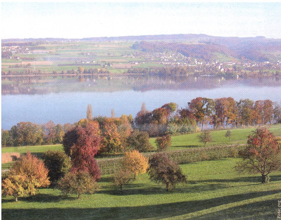
Die naturnahe Landschaft um den Hallwilersee: Die «Visitenkarte des Kantons Aargau» konnte dank Beschwerderecht vor Verschandelung gerettet werden.

Im November stimmen wir über die von der Zürcher FDP-Nationalrätin Doris Fiala lancierten Initiative gegen das Verbandsbeschwerderecht ab. Wem die Natur in der Schweiz am Herzen liegt, legt ein Nein in die Urne. Ein Nein stellt sicher, dass Beschlüsse von Parlamenten oder Gemeindeversammlungen nicht als Vorwand dienen, um geltendes Umweltrecht zu verletzen.